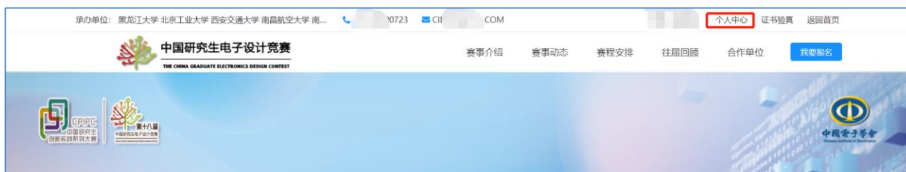
图 赛事官网个人中心入口