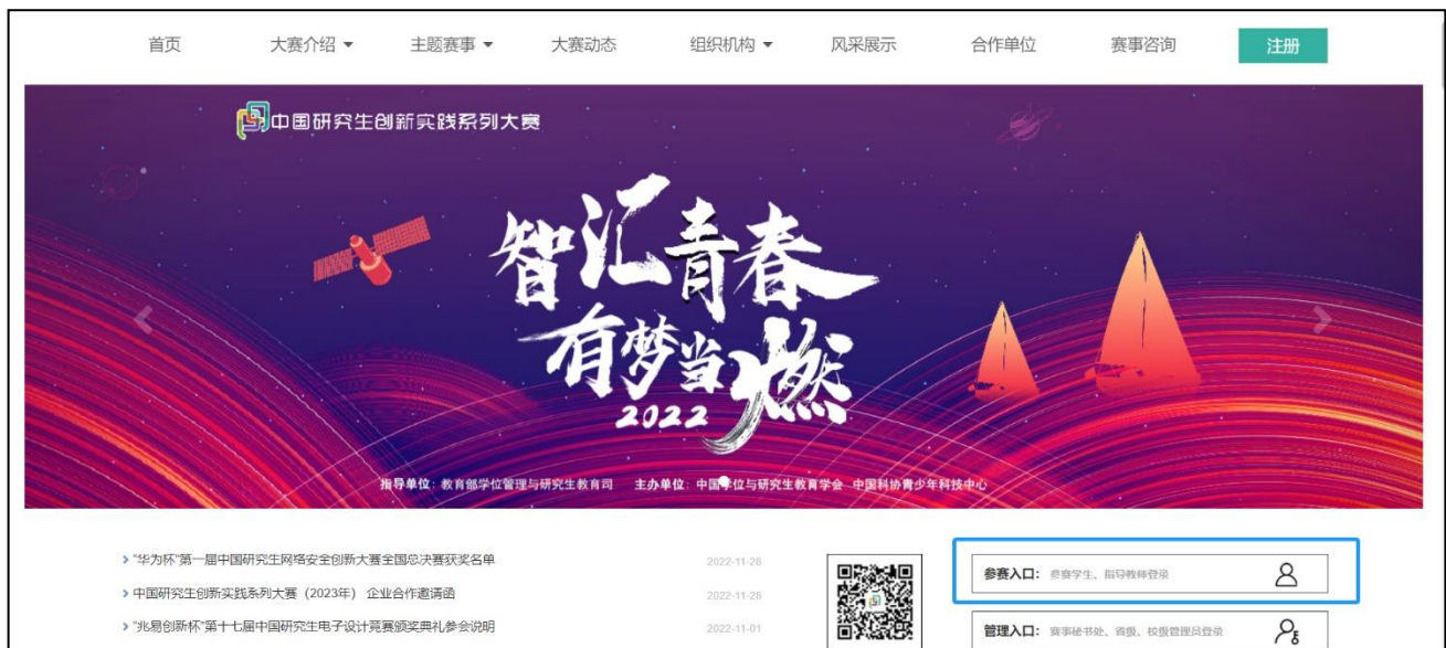
图 平台官网登录窗口