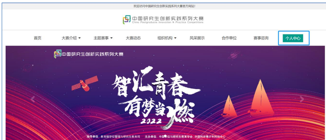
图 平台官网个人中心入口