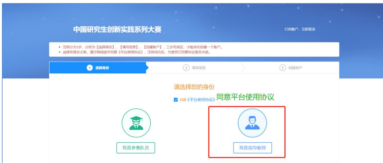
图 用户注册第一步-选择身份