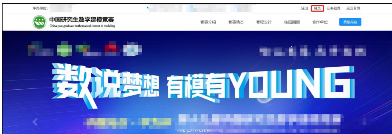
图 赛事官网登录窗口